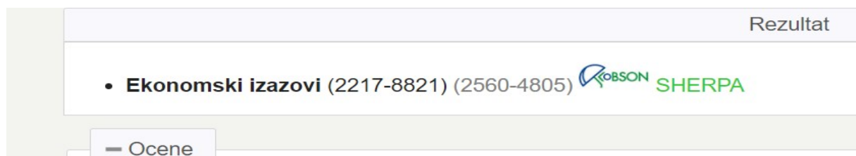
Ilustracija 2: Kategorizacija časopisa „Ekonomski izazovi“

Časopis je trenutno kategorizovan u kategoriji „Ekonomija i organizacione nauke“ sa M51, kao i na međunarodnoj ERIH+ listi.